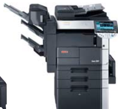
ineo 501 met geïntegreerde afwerkingseenheid (FS-522), boekjesafwerkingseenheid (SD-507) en grote papierlade (PC-407)