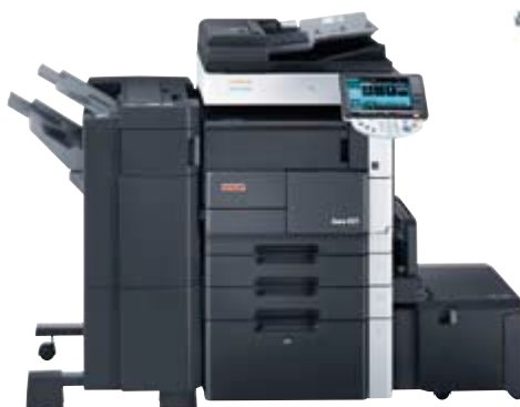
ineo 421 met afwerkingseenheid (FS-523), grote papierlade (PC-407) en eenheid met grote capaciteit (LU-203)