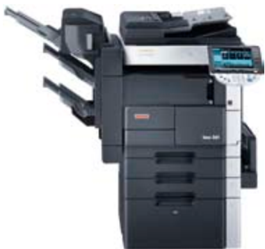
ineo 361 met geïntegreerde afwerkingseenheid (FS-522), boekjesafwerkingseenheid (SD-507) en grote papierlade (PC-407)

De ineo 361/421/501 zijn ontworpen met de behoeften van kantoorafdelingen of werkgroepen in gedachten. De grondig geteste hardware werkt betrouwbaar en levert stabiele prestaties gedurende de lange levensduur. De geavanceerde functies van het systeem omvatten dubbelzijdig printen op dezelfde snelheid, beveiligd printen, snel en geavanceerd scannen (zoals scannen naar e-mail of een plek op het netwerk), individuele gebruikersboxen, gebruikersauthenticatie en kostenbeheer. Hoewel de ineo 361/421/501 boordevol functies zitten, zijn deze multifunctionals compact (onder andere door de optionele, geïntegreerde afwerkingseenheid) en uitermate gebruiksvriendelijk, met name dankzij het grote kleurenbedieningspaneel. In de monotone wereld van zwart-witmachines maken deze onderscheidende kenmerken een groot verschil.