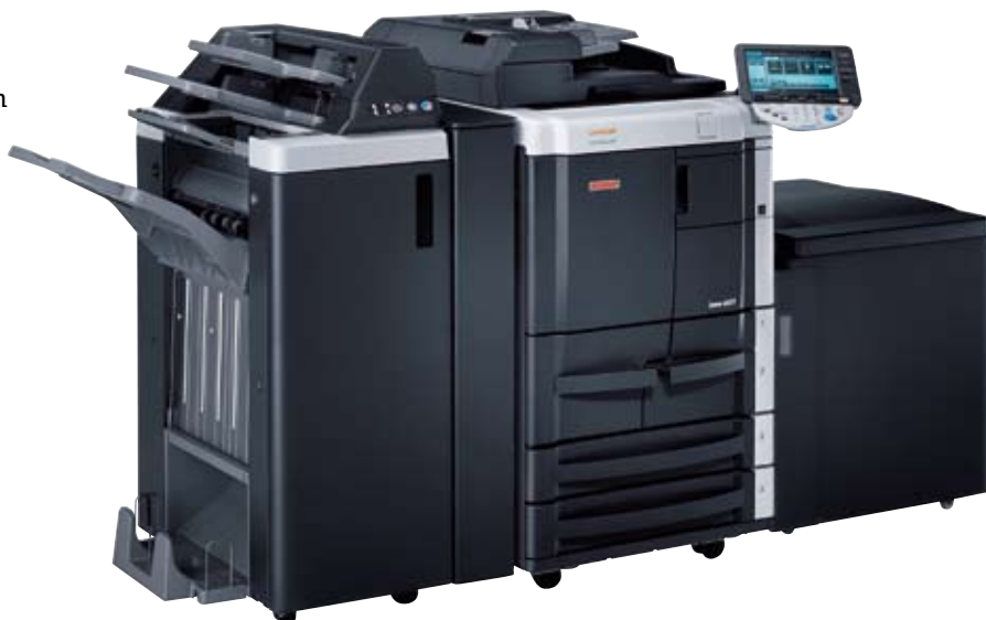
ineo 601 met boekjesafwerkingseenheid (FS-610), optie voor achteraf invoegen van materiaal (PI-504) en lade met grote capaciteit (LU-405)